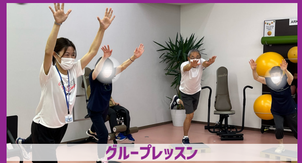
グループレッスン