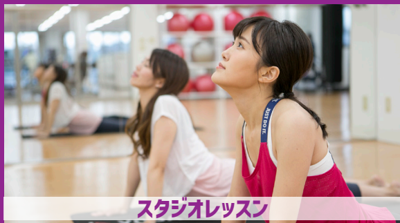
スタジオレッスン