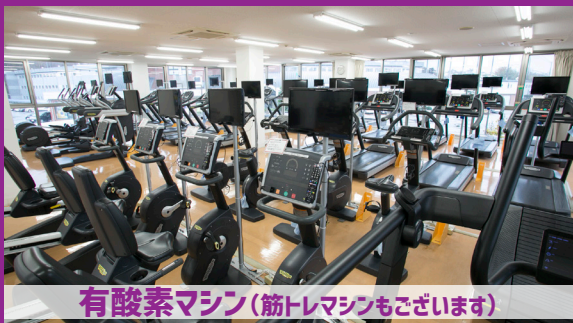
有酸素マシン(筋トレマシンもございます)