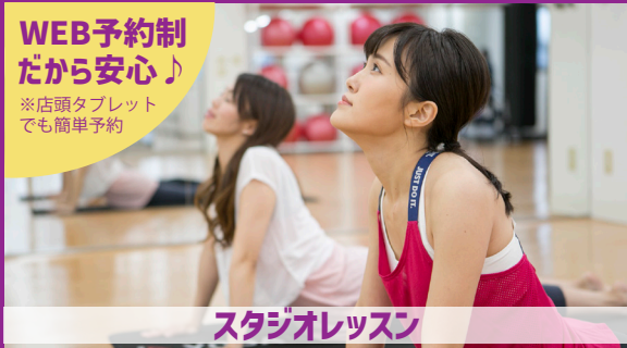
スタジオレッスン