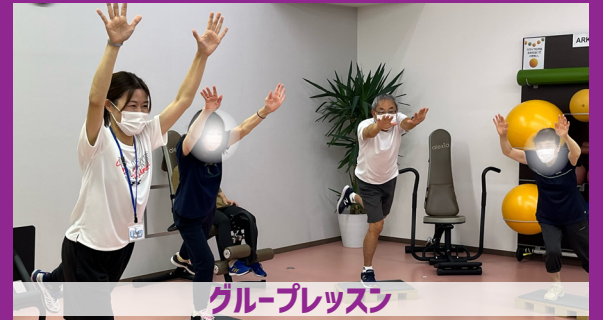
グループブレスン